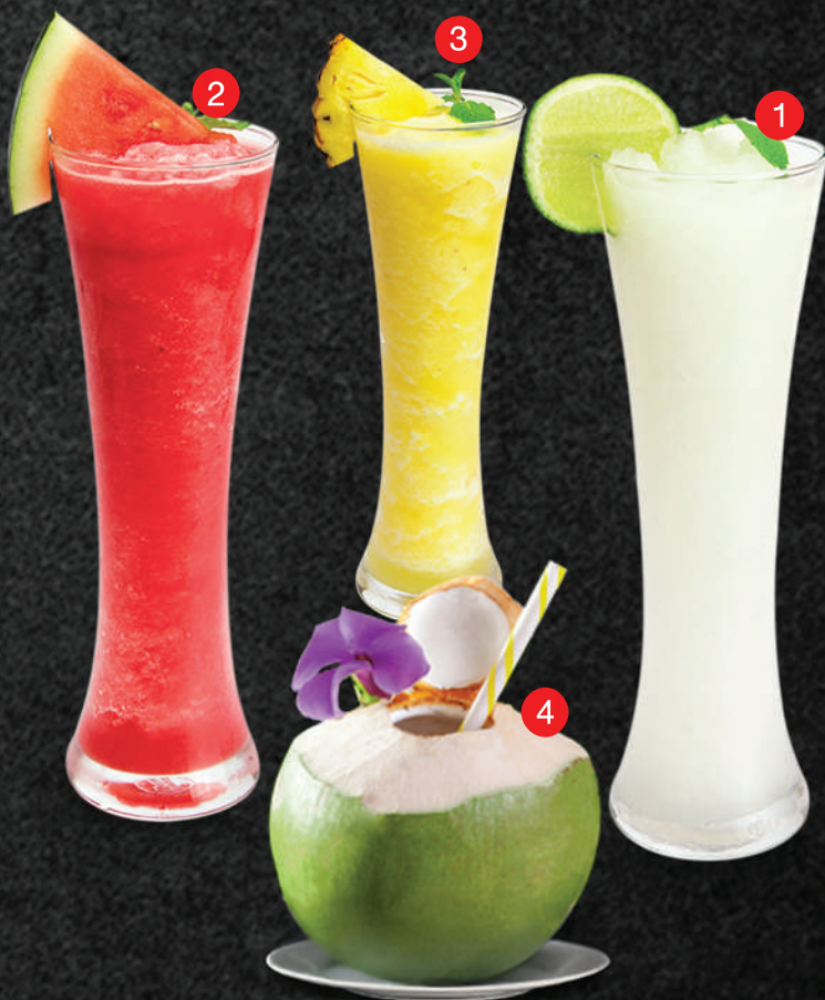
HS112 レモン・スムージー LEMON SMOOTHIE น้ำมะนาวปั่น 129.-