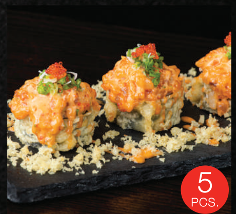
HS070 えび天巻 EBI TEM ROLL 320.- กุ้งเทมปุระโสร (8 ชิ้น)