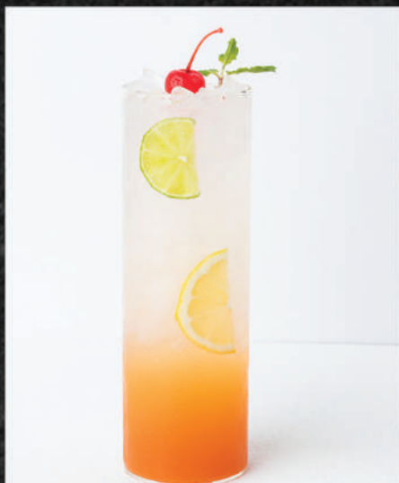
HS109 ピーチソーダ PEACH SPARKLING พีช สปาร์คคอลลิ่ง