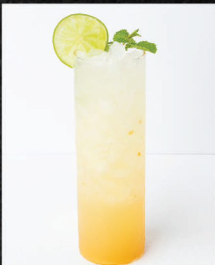
HS110 ゆずソーダ YUZU SPARKLING ยูสุ สปาร์คคอลลิ่ง