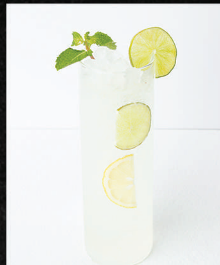
HS111 レモンソーダ LEMON SPARKLING เลมอน สปาร์คคอลลิ่ง